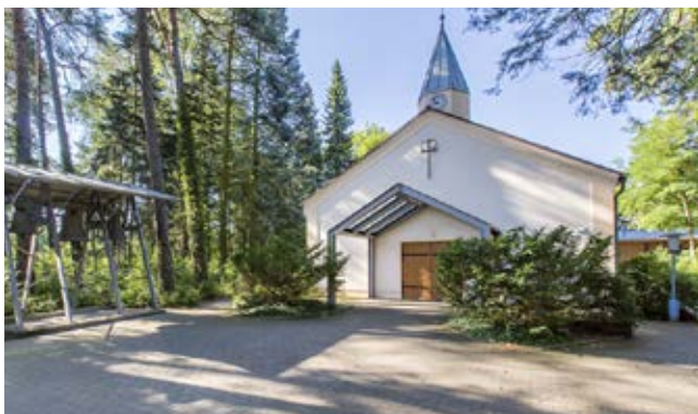
Kirche Lobetal, Foto: Hoffnungstaler Stiftung Lobetal